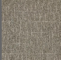
800 - Impala