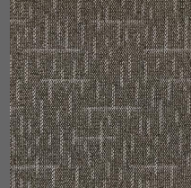
804 - Walker