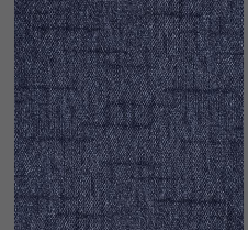
805 - River