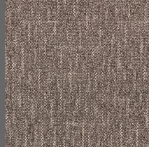
801 - Malibu